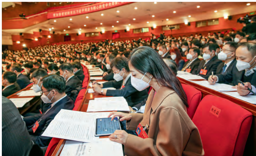
委员们认真听取报告

(四)注重“两支队伍”建设，在提高履职能力上下功夫。围绕更好发挥委员主体作用和提案工作干部队伍服务保障作用，以提高“四种能力”为重点，切实加强创新理论武装和学习培训，进一步提高履职能力和水平。◎