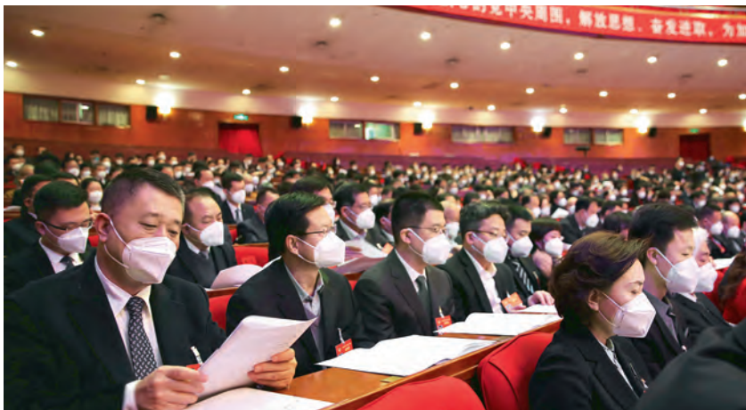
委员们认真听取讲话

党的二十大强调，党确立习近平同志党中央的核心、全党的核心地位，确立习近平新时代中国特色