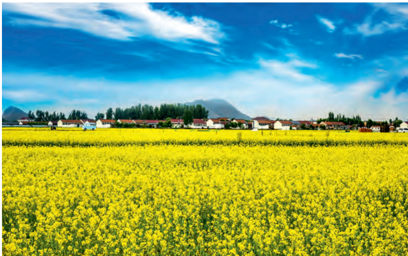
美丽乡村——遵化市山里各庄村

“乡村要振兴，产业必振兴。基于农业发展的一二三产业融合发展，必须要坚持精准发力，立足特色资源，关注市场需求，发展优势产业，加快形成新型工农城乡关系，