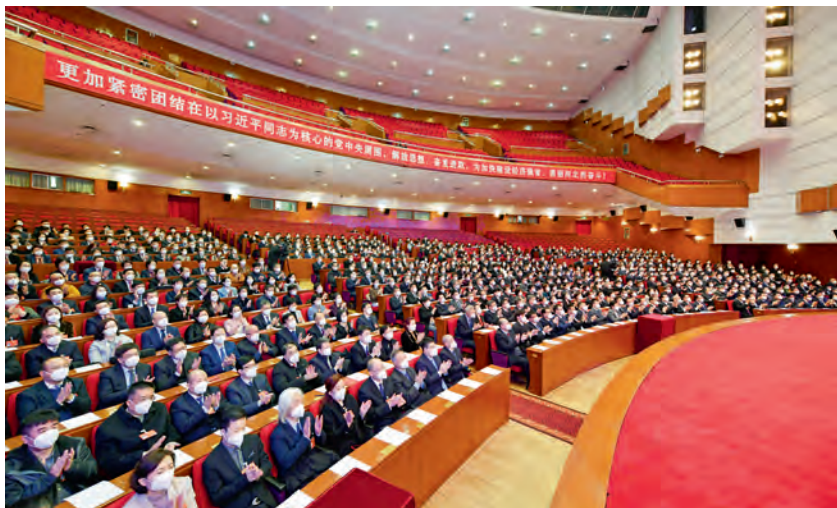
委员们认真听取报告

（三）强化改革创新，推动提案工作与时俱进。一是创新协商方式。积极探索开展提案办理远程协商，2020年对19件涉及应对新冠肺炎疫情冲击和影响、支持中小企业发展的相关提案，以视频会议形式进行打包协商督办，取得明显效果。积极开展提案督办界别协商，围绕“互联网+医疗”，邀请医药卫生界别委员、专家学者召开界别协商座谈会，有力推动了相关问题的解决。二是积极推动“开门办案”。围绕改善营商环境、支持石家庄国际陆港建设、中医药强省、厕所革命等重点问题提案，先后组织开展