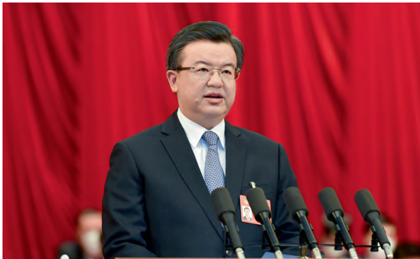
省委书记倪岳峰在开幕式上讲话