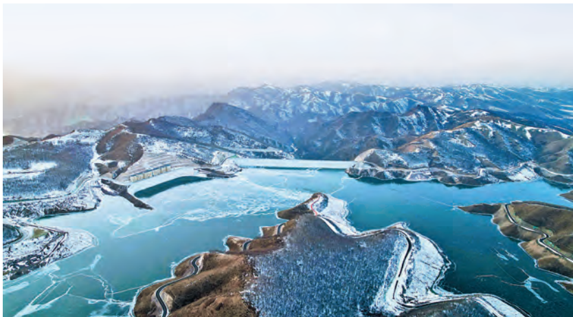
作为我国自主设计和建设的世界在建最大抽水蓄能电站，丰宁电站建设创造了抽水蓄能电站的多项第一。图为丰宁抽水蓄能电站上水库

省政府工作报告提出，实施主导产业壮大行动，聚焦钢铁、装备、石化、食品等传统优势产业，开展高端化、智能化、绿色化技改专项行动；壮大农业特色主导产业，强龙头、补链条、兴业态、树品牌，