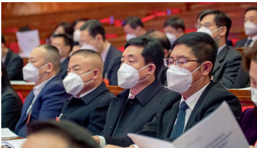
委员们认真听取讲话

社会主义思想的指导地位，反映了全党全军全国各族人民共同心愿，对新时代党和国家事业发展、对推进中华民族伟大复兴历史进程具有决定性意义。我们要旗帜鲜明讲政治，忠诚捍卫“两个确立”，增强“四个意识”，坚定“四个自信”，做到“两个维护”，矢志不渝沿着习近平总书记指引的方向阔步前进。 要坚定不移维护总书记核心地位。 习近平总书记作为党中央的核心、全党的核心，始终是风雨来袭时中国人民最可靠的主心骨，是中华民族伟大复兴的领航人。任何时候任何情况下，我们都要坚定政治立场，