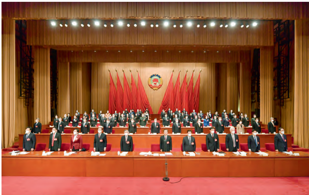
大会开幕 奏唱国歌