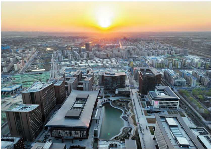
迎来巨变的雄安新区

交通，被认为是“现代化的开路先锋”。四通八达的交通网络，有效推动了三地间人流、物流、信息流等要素加速流通和周转，是支撑经济社会高质量发展的重要一环。交通上的不断突破，只是京津冀协同发展向纵深推进的一个缩影。近年来，河北紧紧扭住北京非首都功能疏解这个“牛鼻子”，全面落实“三区一基地”功能定位，从交通无缝衔接，到生态携手保护，再到产业转移升级，不断推动京津冀协同发展迈向更高层次。石家庄借力京津产业优势和科技资源，理顺产业发展链条，改造提升产业结