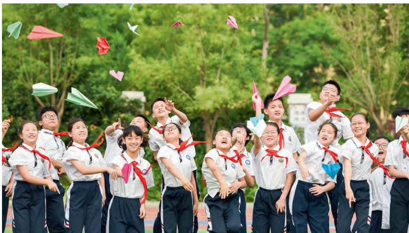
邯郸市邯山区阳光实验小学的毕业生们放飞写有梦想的纸飞机

王利军委员建议，实施创新驱动发展战略，人才强省战略，尽快解决科技创新能力不足的问题。加快开展新型能源强省战略，发展风